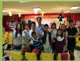
品德戲劇比賽榮獲優等