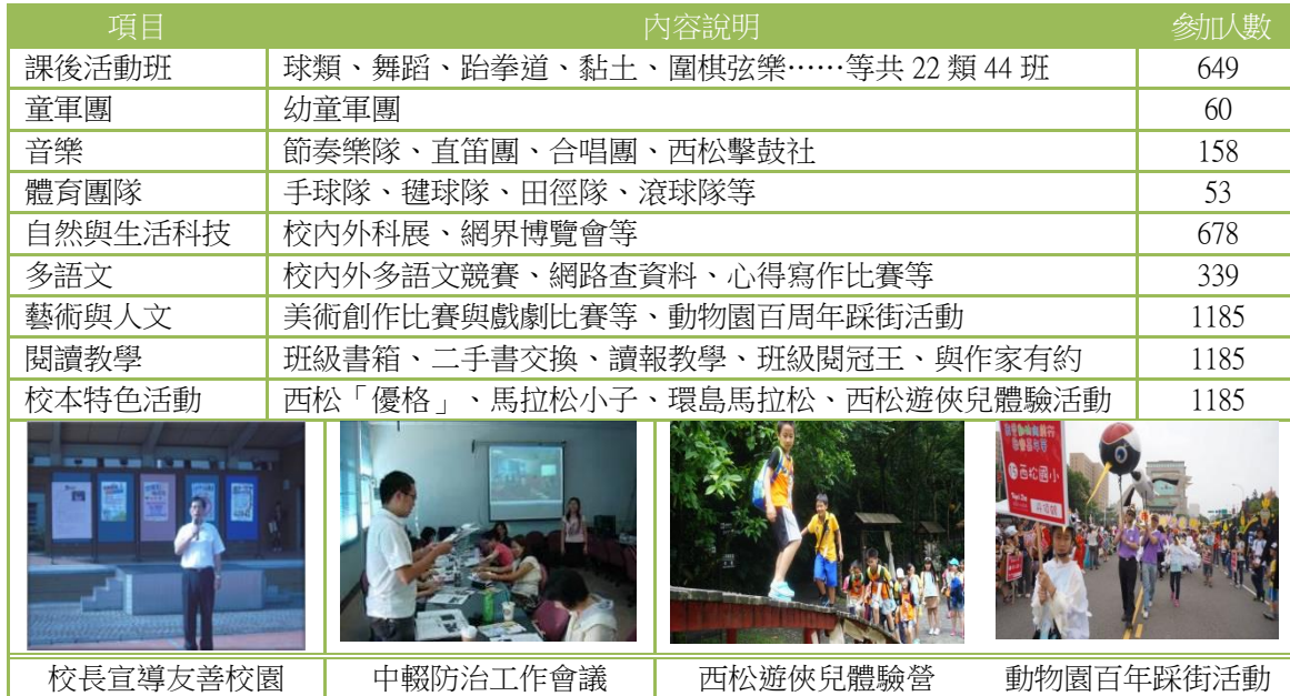
102 學年度多元學習推廣成果表

2.多元發展樂學習： 學生參與多元化的的學習活動，不但能發展個人興趣，還能表現自我進而肯定自我，使之樂於向學。本校多元學習推廣情況如下表：