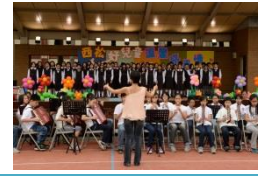
西松溫馨情 合唱節奏樂聯演