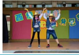
兒童節舞蹈才藝表演