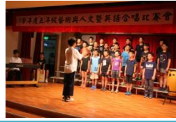
英語暨藝術人文領域 成果發表會