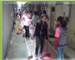
社區打掃感恩惜福