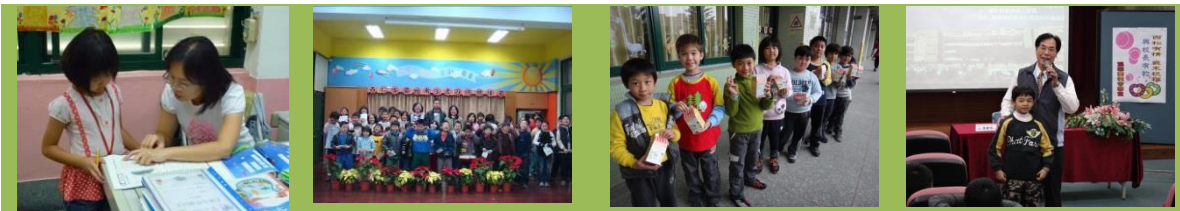
弱勢生免費課後照顧 | 好市多贈送弱勢生書包 | 愛心撲滿搶救受飢兒 | 與校長有約溫馨會客室

2.課業輔導揪甘心： 秉持弱勢照護，一個都不少原則，結合以下資源，讓學生能快樂學習。（1） 攜手激勵班： 以弱勢生且成績落後為對象，規劃補救教學課程方案。（2） 課後照顧班： 老師於放學後指導課業，對弱勢學生有免費補助。（3） 晨光補救教學： 本校向日葵志工團利用晨間對學習弱勢學生補救教學。