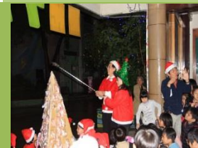
歲末感恩點燈活動