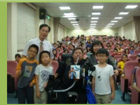
生命鬥士分享生命歷程