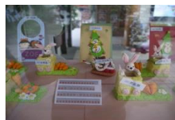
黏土創意捏塑成果展