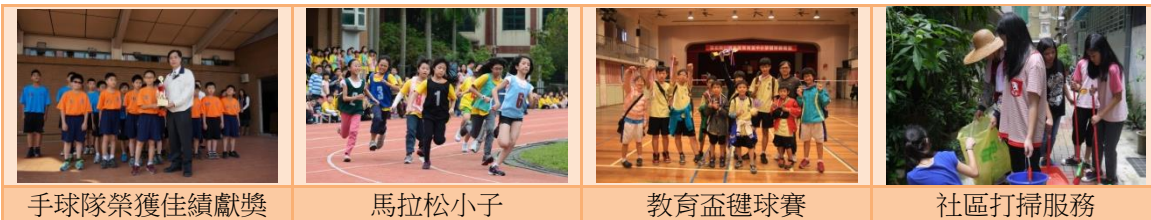
手球隊榮獲佳績獻獎

品德教育是學校教育的核心價值，由外而內的身教境教進行品德陶冶，由內而外認知自願行動生活實踐，培養學生一生當中做人做事的態度與信念，是西松培養優秀公民的重要教育目標。首要溝通觀念，全校師生共同落實生活教育；透過明確合理宣導生活規範的要求，並落實執行；積極落實培養學生之榮譽感，做好灑掃應對進退之事宜，並實施榮譽競賽，如整潔、紀律競賽等；瞭解學生需求，注重潛在學習，發揮境教、身教等之功能；加強激發學生自發性的檢討，落實內化生活常規。並導引出自律、誠信、關懷、感恩、負責、尊重、孝順、禮儀、公德等優良品德。