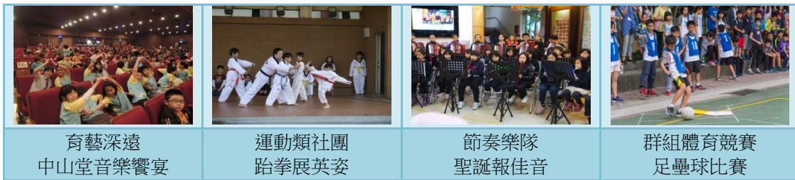
育藝深遠 中山堂音樂饗宴