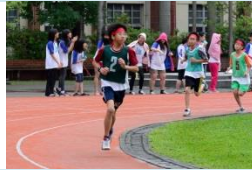
馬拉松小子跑步活動