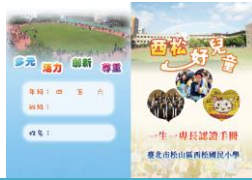
西松好兒童 一生一專長認證手冊